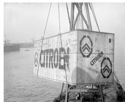
La Croisière Jaune (1931-1932)

Les dossiers documentaires du Conservatoire CITROËN