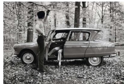
Ami 6 (1961-1969)

Les dossiers documentaires du Conservatoire CITROËN